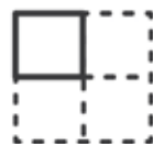
Módulo (panel contenedor)